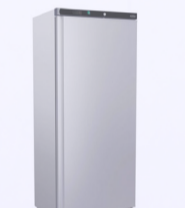
CONGÉLATEUR EN ACIER INOX 1 PORTE 979€ HT