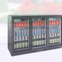
MEUBLE D'EXPOSITION POUR BOUTEILLES -865€ HT 557€ HT