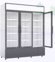
ARMOIRE VITRÉE POSITIVE 3 PORTES -1999€ HT 1717€ HT