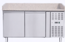
TABLE DE PRÉPARATION 2 PORTES -1590€ HT 977€ HT