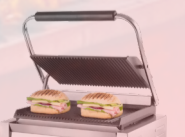
GRILL PANINI -232€ HT 219€ HT