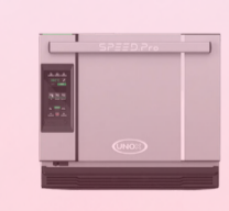
FOUR À CONVECTION À CUISSON ACCÉLÉRÉE -7600€ HT 6890€ HT