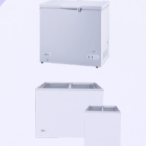
CONGÉLATEUR COFFRE -650€ HT 564€ HT