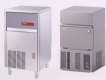
MACHINE À GLAÇONS PLEINS -1159€ HT 963€ HT