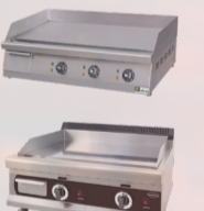
PLANCHA -575€ HT 539€ HT