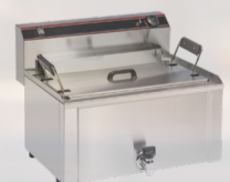
FRITEUSE BEIGNETS -695€ HT 599€ HT