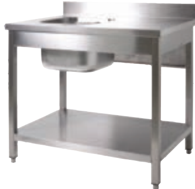
TABLE INOX AVEC ETAGERE